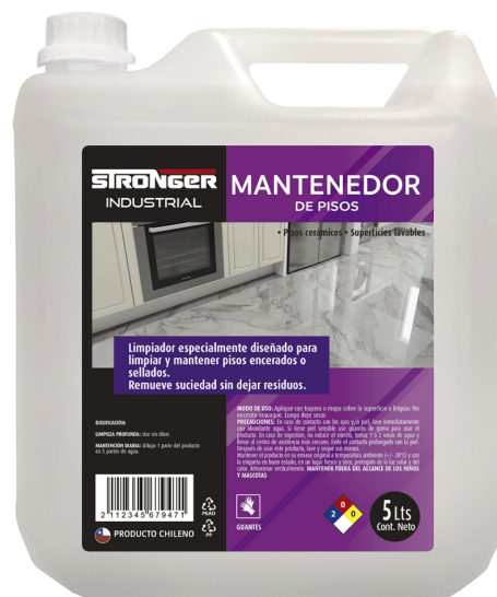
Formato 5 Litros