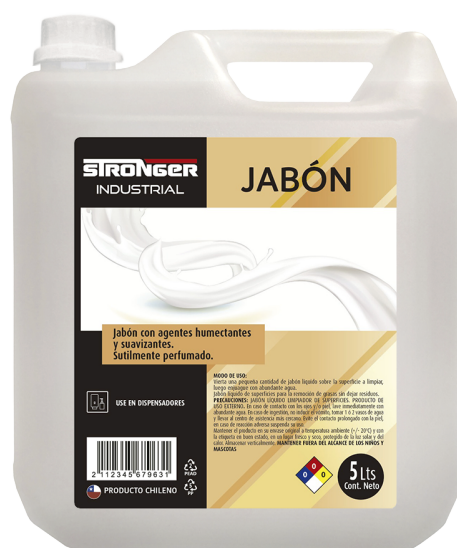
Formato 5 Litros